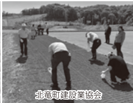
北竜町建設業協会