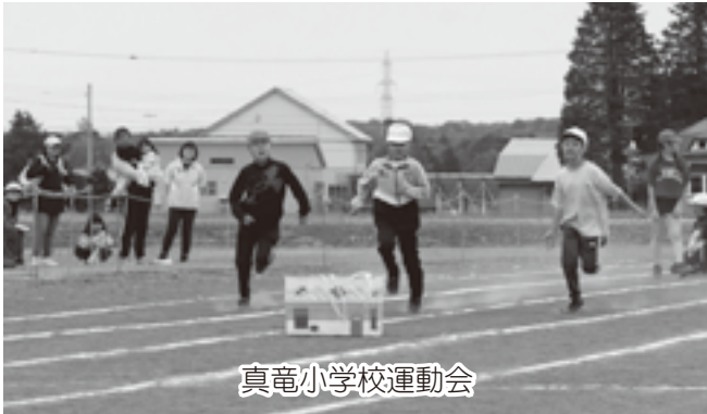
真竜小学校運動会

また、6月13日にはやわら保育園園庭にて大勢の保護者や来賓が見守る中、やわら保育園運動会が開催されました。当日は天気も良く、園児達がこの日のために練習した踊りや組体操などを披露し、観覧した保護者からはたくさんの拍手が起きていました。