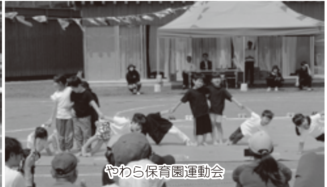
やわら保育園運動会