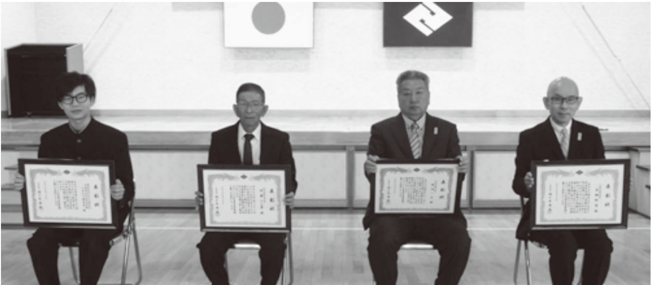
北竜町立北竜中学校 ひまわり委員会

北竜中学校は平成3年より「世界のひまわり栽培」に取り組み、現在までその活動を継続しています。また栽培だけではなく、観光客に対する「ひまわりガイド」や手づくりの「のぼり」の作成を行い、ひまわりまつりにとって無くてはならない存在として多くの観光客に感動を与えています。その功績が認められ、平成21年には北海道知事より「観光ホスピタリティ実践感謝状」の授与、平成25年には北海道開発局より「第6回「わが村は美しく、北海道」」を受賞、平成31年には北海道空知教育局より「空知管内教育実践表彰」を受賞しています。