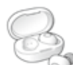
ワイヤレスイヤホン