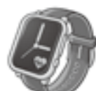
スマートウォッチ