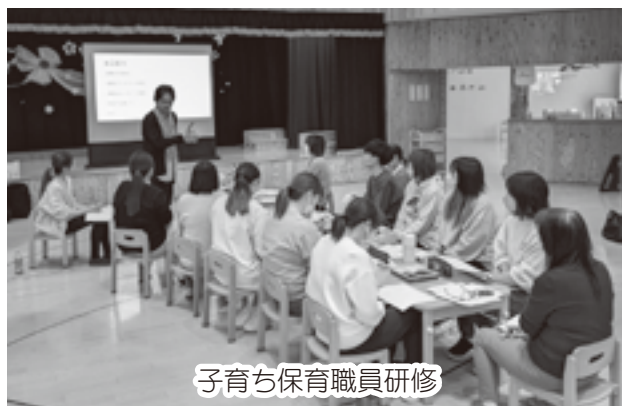
子育て保育職員研修