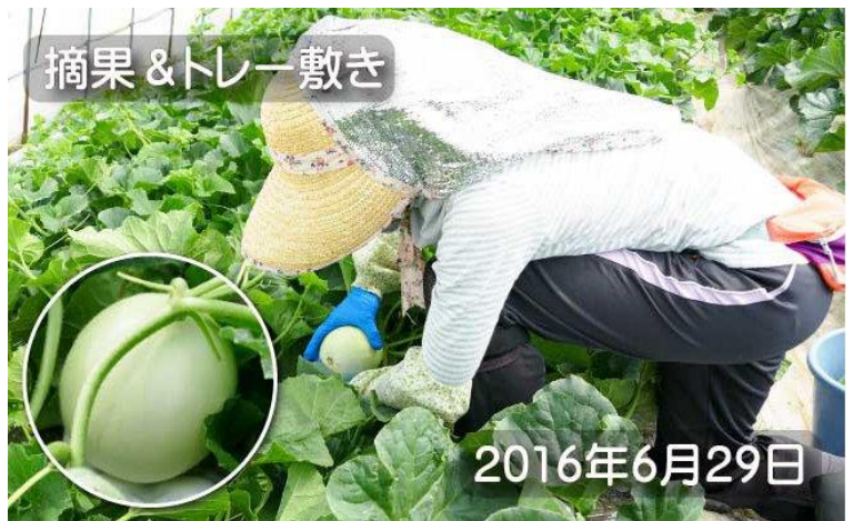
摘果 & トレー敷き