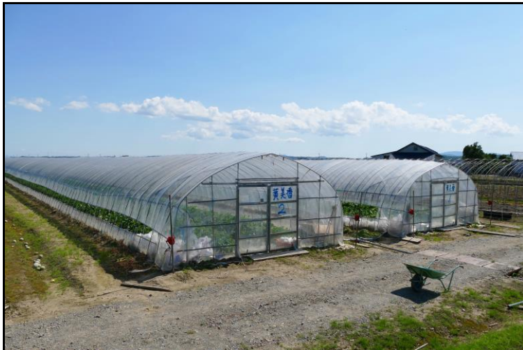
▲ 黄美香メロンが栽培されている2棟のビニールハウス。