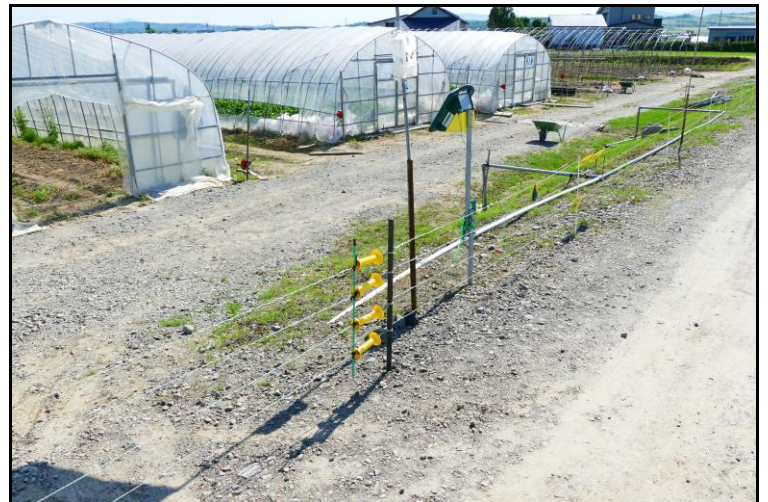
▲ ビニールハウスの周りには大事なメロンが荒らされないように電牧柵が設置されています。電気が流れていますので触るとビリッと！ おいしいメロンは野生動物もすぐに嗅ぎ付けちゃうんですね。