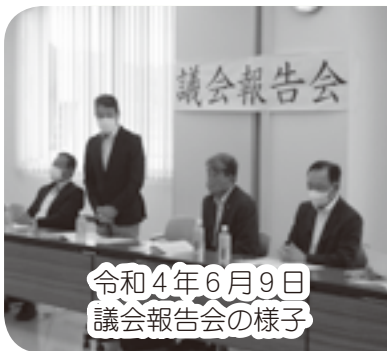
令和4年6月9日 議会報告会の様子